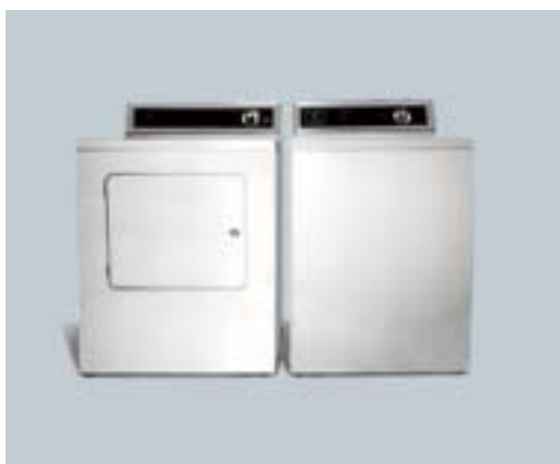
7 ~ 15 時間 通常の防縮試験方法