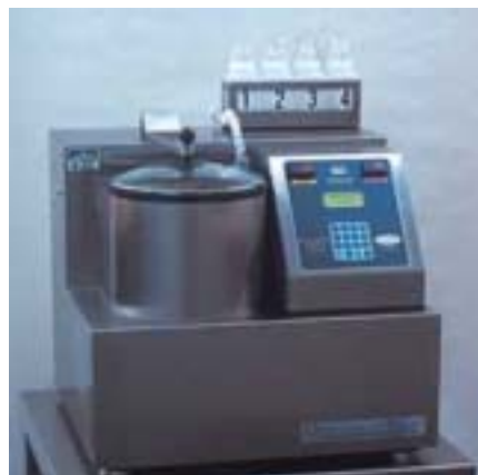
15 分 クイックウォッシュ・プラス

製造元:RAITECH,INC 1900-E Center Park Dr. Charlotte, NC. USA TEL 1-803-681-6518 FAX 1-803-681-9829